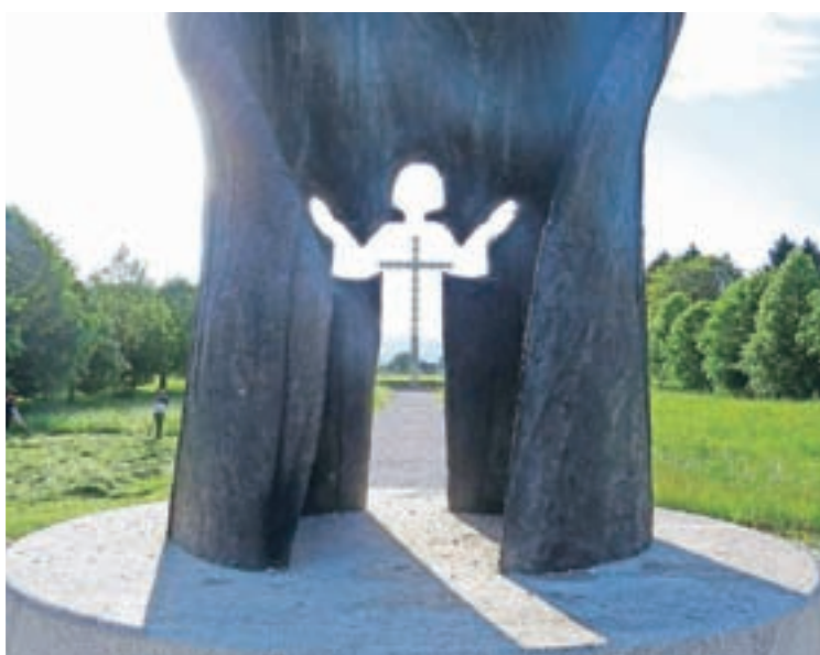
V društvu ŠmaR Žiri tudi letos načrtujejo eno daljše romanje.

Skratka, kljub epidemiji je pred nami pester program, zato vsi lepo vabljeni, da se nam pridružite z idejami in predlogi ali pa vsaj s podpisom kot podporni član TD Žiri.