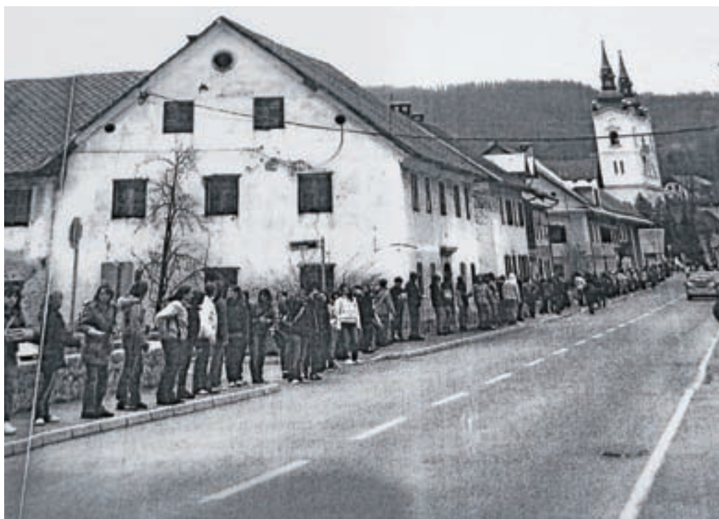
Fotografska razstava govori o selitvi Krajevne knjižnice Žiri leta 2009.