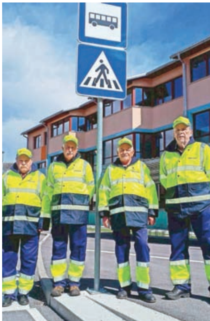
Člani AMD Žiri že šest desetletij skrbijo za varnost v cestnem prometu.