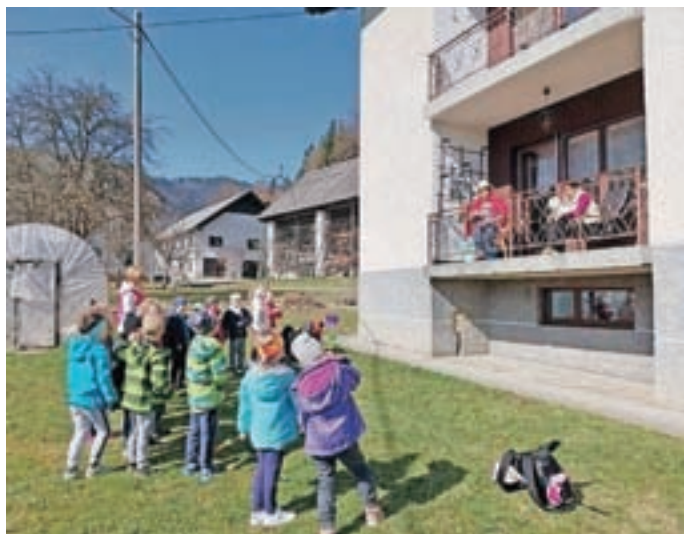
Vrtčevski otroci so se spet podali na sprehod s pesmijo.