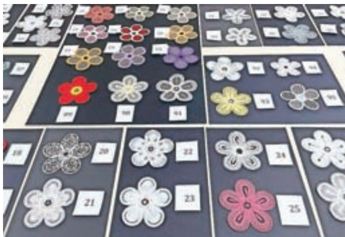
Na letošnji natečaj je prispelo kar sto čipk v obliki češnjevih cvetov.