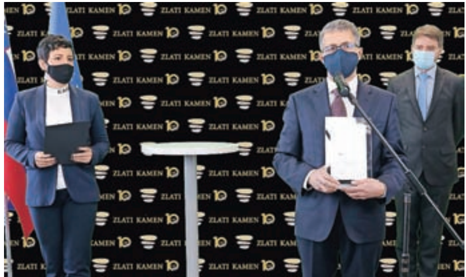
Občina Žiri je na podelitvi Zlati kamen sredi februarja prejela laskavi naziv občina zdravja 2021.

Kot so poudarili na NIJZ, Občina Žiri dosega odlične rezultate na področju zdravja prebivalcev. "Otroci in mladostniki te občine so v slovenskem prostoru najbolj gibalno učinkoviti, med njimi je tudi najmanj prekomerno hranjenih," so poudarili in dodali, da je vzgoja za zdrav življenjski slog v obdobju otroštva in mladostništva najbolj racionalna in smiselna. Da tudi starši otrok in mladostnikov ter drugi odrasli v Žireh dobro skrbijo za svoje zdravje, pa po njihovem nakazujejo dobri kazalniki na področju prehranjenosti odraslih in pa zelo dober odziv na Žirfit – testiranje telesnih zmogljivosti odraslih prebivalcev. Kot so navedli, preventivna akcija za zdravo življenje v Žireh poteka 17 let, v akciji pa sodeluje zelo veliko število prebivalcev. "Da je skrb za zdravje Žirovcem blizu, nam kaže tudi odlična odzivnost v presejalnih