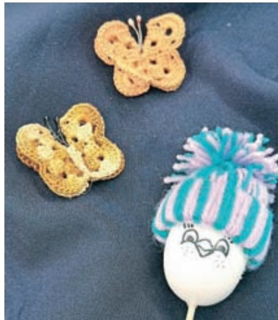
Razstava članic Društva invalidov Žiri iz skupine ročnih del