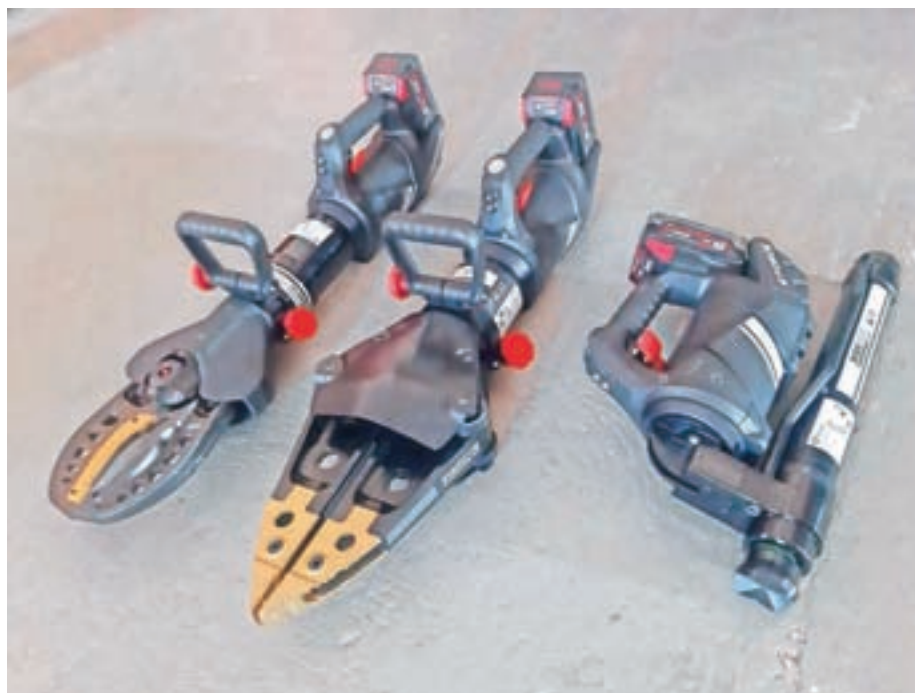
Novo baterijsko hidravlično orodje E-Force3

Februarja je bil izveden javni razpis za nabavo podvozja za novo gasilsko avtociSterno. Za nas velika pridobitev letos pa je nakup novega baterijskega hidravličnega orodja Weber Hydraulik E-Force3, ki se prvenstveno uporablja pri tehničnem reševanju ob prometnih nesrečah. Novo orodje – škarje, razpiralo, cilindar – bo zamenjalo orodje, s katerim je bilo doslej opremljeno naše hitro tehnično reševalno vozilo.