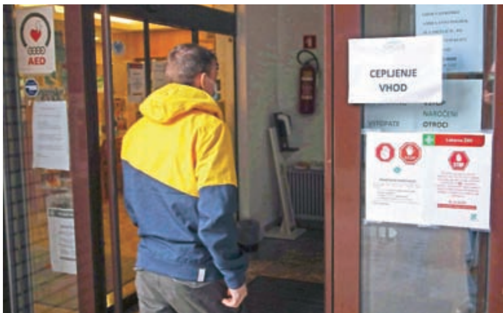
Cepljenje proti covidu-19 je v Žireh dobro organizirano, cepiva pa je premalo.

O tem, da je cepljenje najboljša možna zaščita proti težavam, ki jih prinaša novi koronavirus, je bilo povedanega in napisanega že veliko, kljub temu pa velja še enkrat poudariti, da se virus covid-19 izjemno hitro širi, saj so okužene osebe že dva dni pred pojavom simptomov in teden dni po preboleli okužbi aktivni prenašalci bolezni. Poleg tega pa sta pri kar dvajsetih odstotkih okuženih