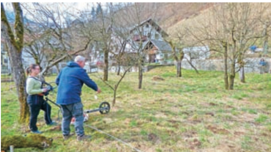
Georadarska raziskava na območju nekdanjega pokopališča v Starih Žireh